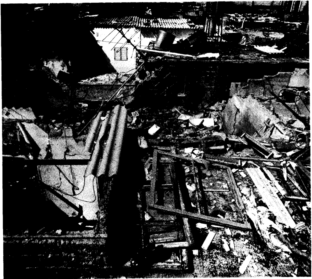
הריסת בתים בחיאן יונס 10.2.93, צולם ב-15.2.93