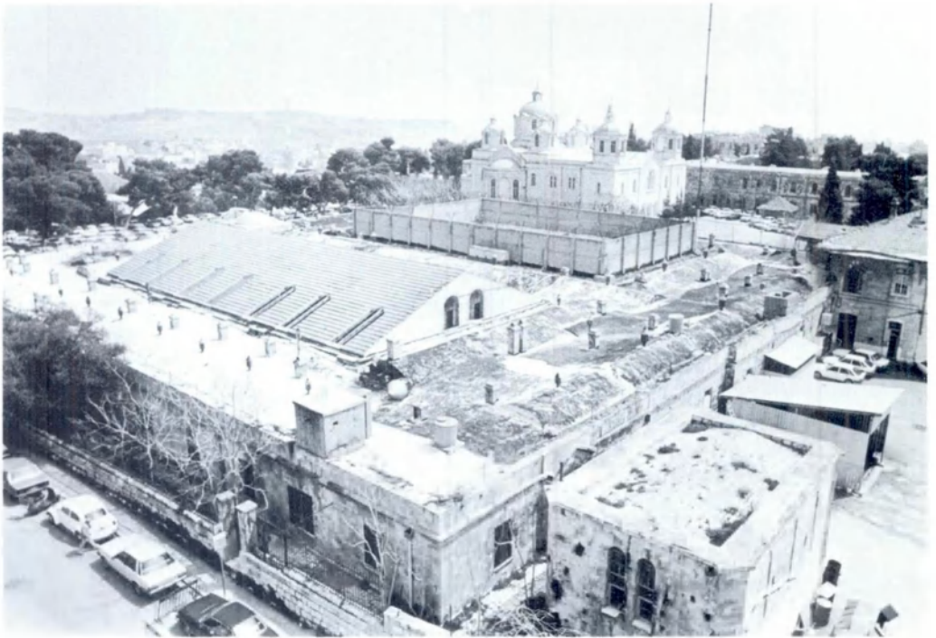
בית-המעצר במגרש-הרוסים

דוברת מטעם המשטרה מסרה לנו כי קיים נוהל להודעה למשפחות על מעצר בניהן. לפי נוהל זה מודיעים למשפחה בטלפון. מייד עם מעצר הבן/בת, ואם אין למשפחה טלפון, שולחים ניידת עם שוטרים כדי להודיע להם. למרות טענת המשטרה, כי נוהל זה מופעל תמיד, שמענו תלונות על אי הודעה למשפחות על מקום הימצאם של ילדיהם. אין הסדר למסירת הודעה למשפחה על הבאת קטין בפני שופט להארכת מעצר ולמשפט או על העברת קטין ממתקן מעצר אחד לאחר.